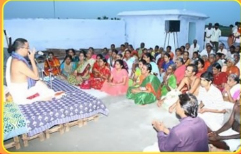
சீவன் கோவில் சும்பாபிஷேகம், தூசி மாமண்டூர், காஞ்சிபுரம் செப்டம்பர் 1, 2009