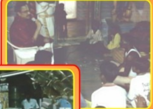
ஊழங்கல்சேர் க்ராமம் செப்டம்பர் 21, 2009