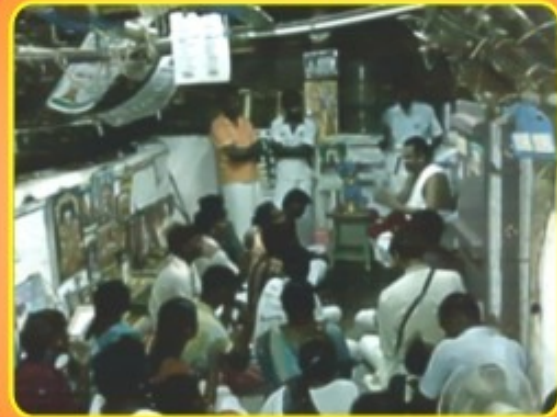
கலட்டுபட்டி க்ராமம் செப்டம்பர் 20, 2009