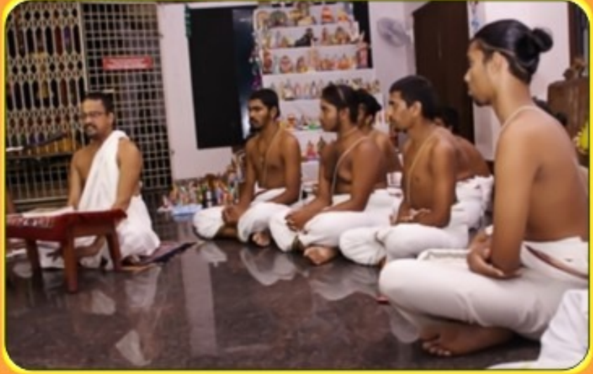
நவராத்திரி - மதுரபுர் ஆஸ்ரமம் - உபன்யாசம்