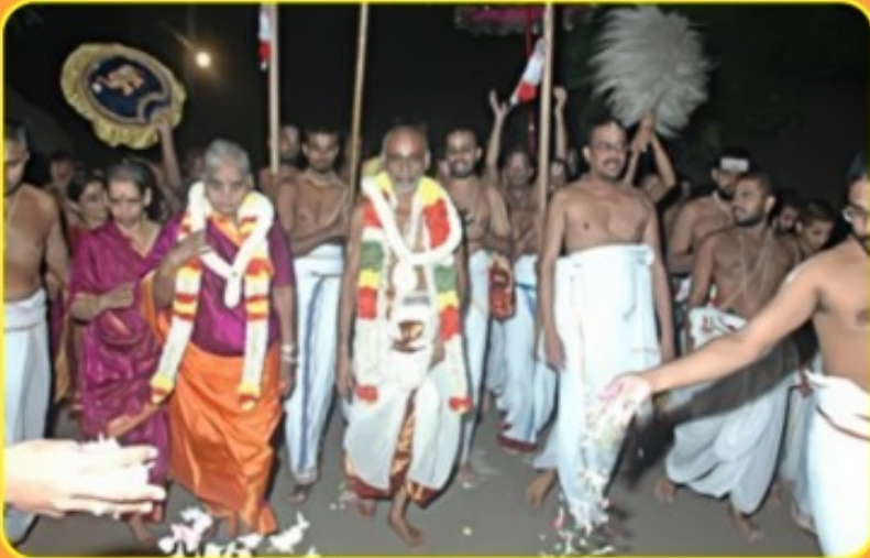
சேங்களுர் செப்டம்பர் 11, 2009