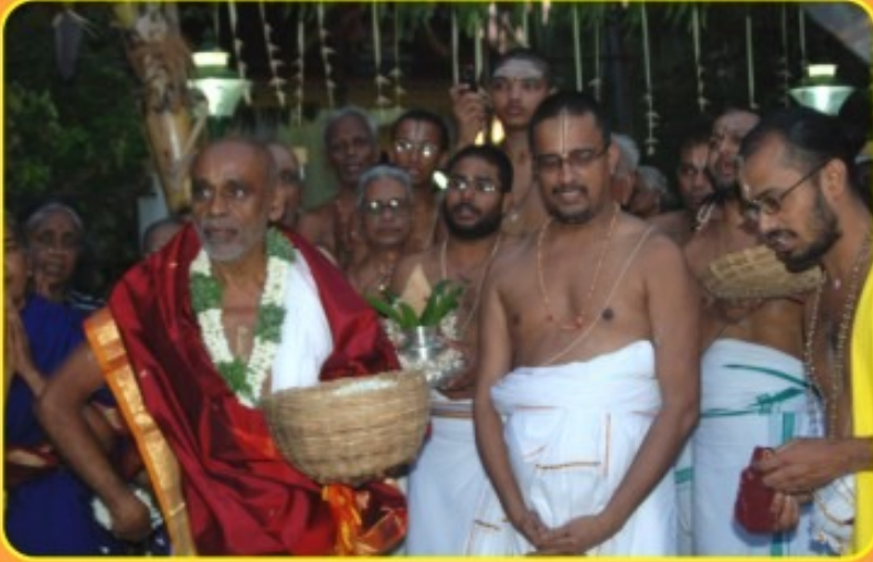
கோவிந்தபுரம் அசுதன்ய குளர் ஆண்டு விழா செப்டம்பர் 4, 2009