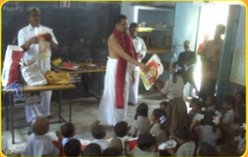
வெள்ளை கீராமம், அரசு சீருவர் பள்ளி (சீருடை வழங்கல்) செப்டம்பர் 21, 2009