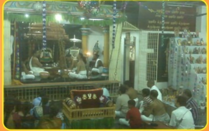
நவராத்திரி - மதுரபுர் ஆஸ்ரமம் - செப்டம்பர் 19-27, 2009