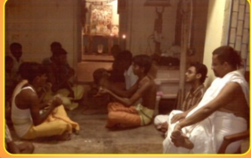
வைப்புர் க்ராமம் செப்டம்பர் 21, 2009