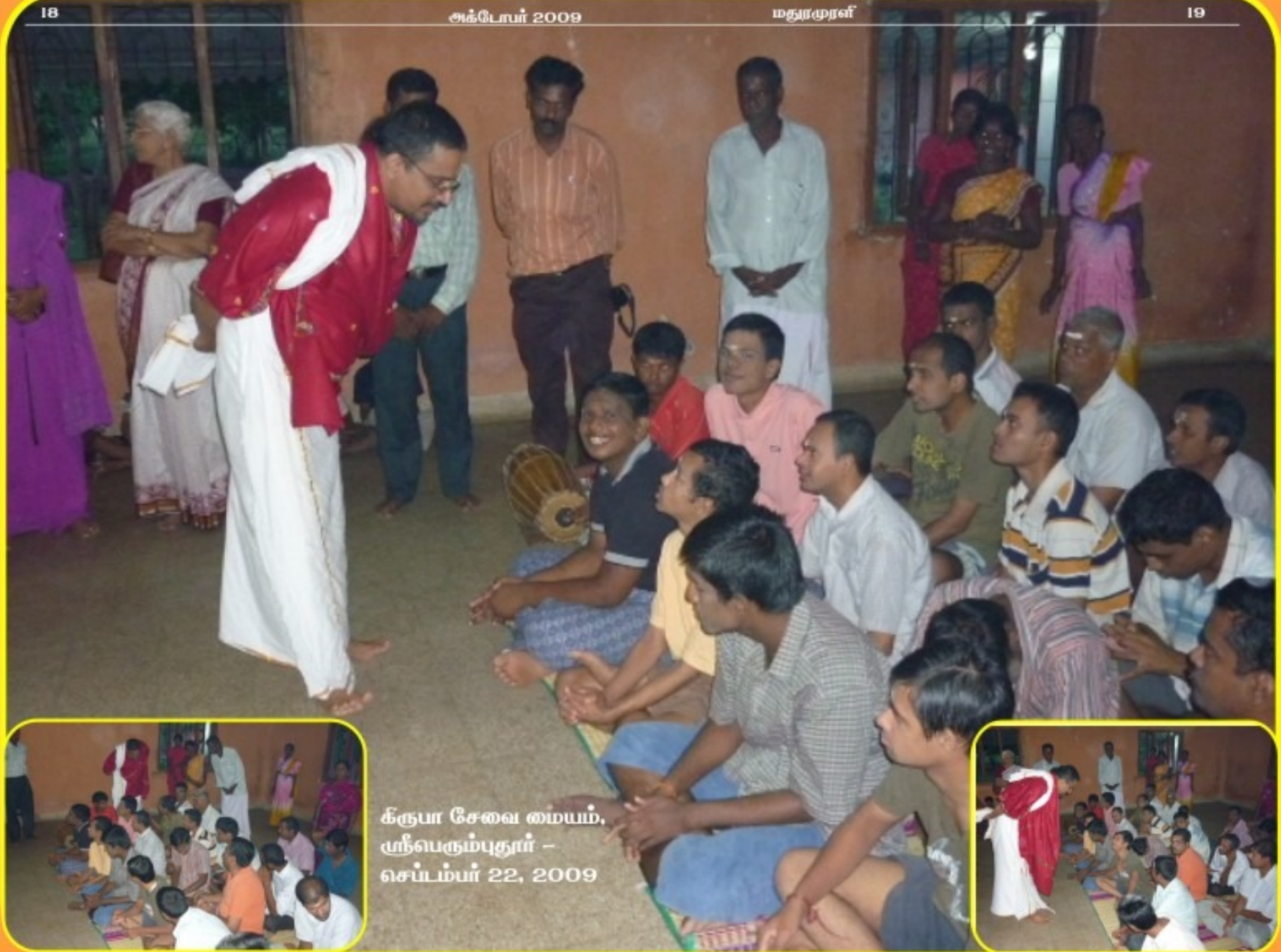
கருபா சேவை மையம், ஸ்ரீபெரும்புதூர் - செப்டம்பர் 22, 2009